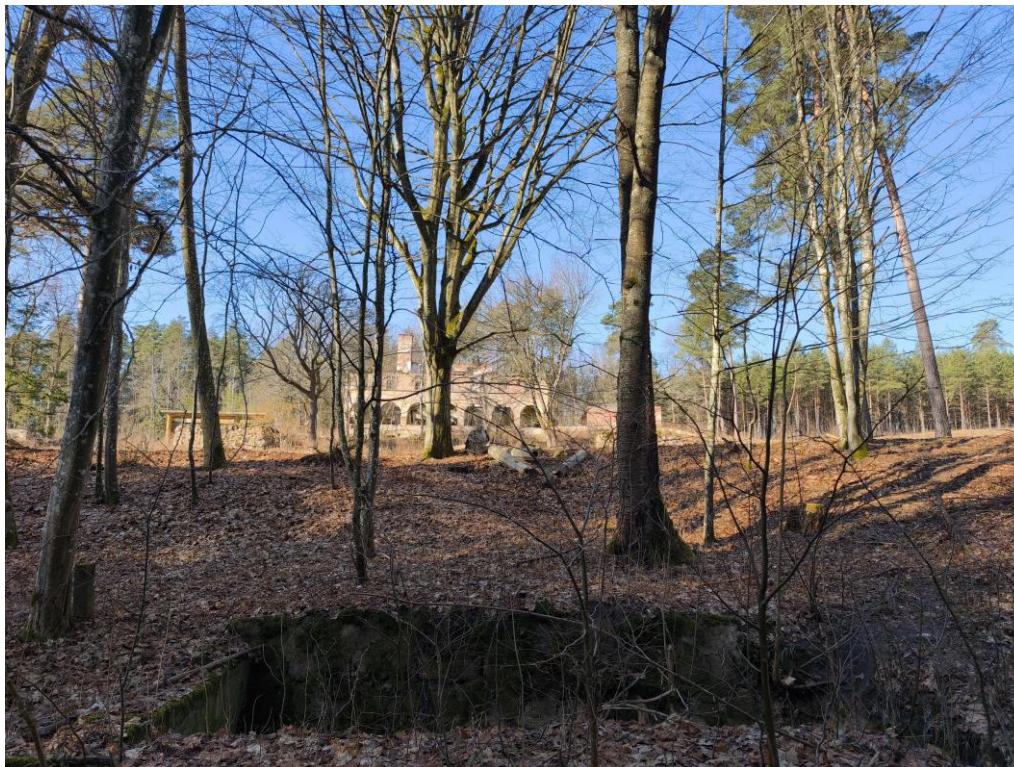
Fot. 3 Roślinność wysoka

Warstwę zielną omawianego terenu stanowią pospolite gatunki traw, bylin i chwastów. Roślinność wysoką reprezentują pojedynczo rosnące lub tworzące niewielkie grupy drzew: sosna pospolita, brzoza brodawkowata, lipa drobnolistna, klon pospolity.