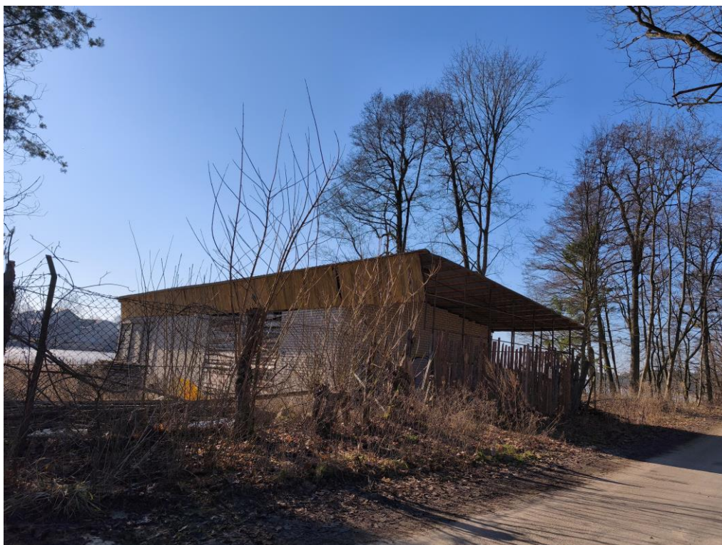
Fot. 2 Pozostałości zabudowy po byłym ośrodku wypoczynkowym