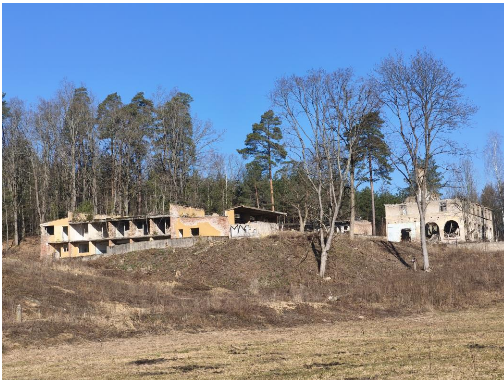
Fot. 1 Pozostałości zabudowy po byłym ośrodku wypoczynkowym