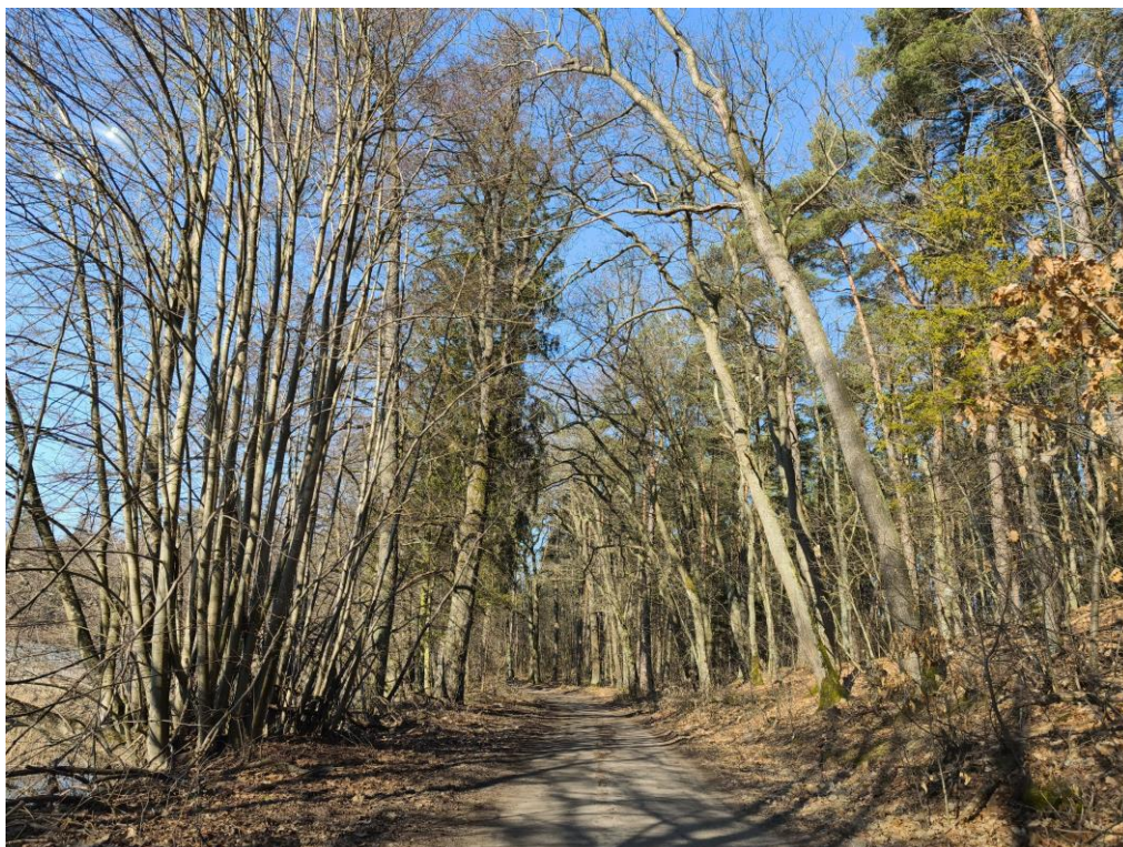
Fot. 3 Istniejąca roślinność okalająca jezioro Kalwa oraz fragment użytku leśnego

Ukształtowanie omawianego terenu stanowi pozostałość po zlodowaceniu bałtyckim z przekształconą formą akumulacji lodowcowej i wodnolodowcowej. Charakteryzuje się zróżnicowanym ukształtowaniem powierzchni. Teren o prostych warunkach gruntowo-wodnych, przydatnych pod zabudowę. Kategorię geotechniczną całego obiektu budowlanego należy potwierdzić na podstawie badań geotechnicznych z właściwym określeniem warunków gruntowych zgodnie z rozporządzeniem Ministra Transportu, Budownictwa i Gospodarki Morskiej z dnia 25 kwietnia 2012r. w sprawie ustalania geotechnicznych warunków posadawiania obiektów budowlanych (Dz. U. z 2012r. poz. 463).