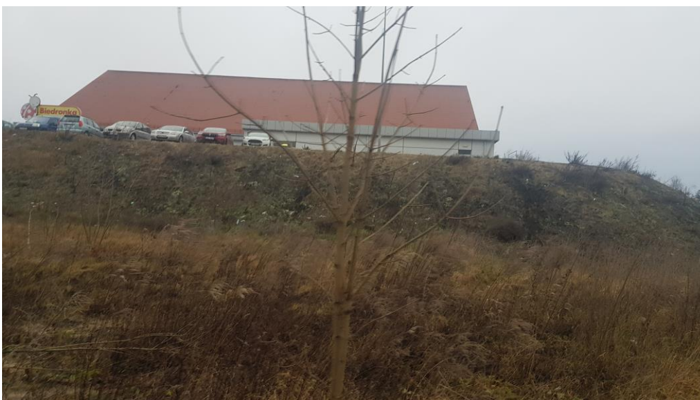
Fot.4. Skarpa o stromych zboczach.