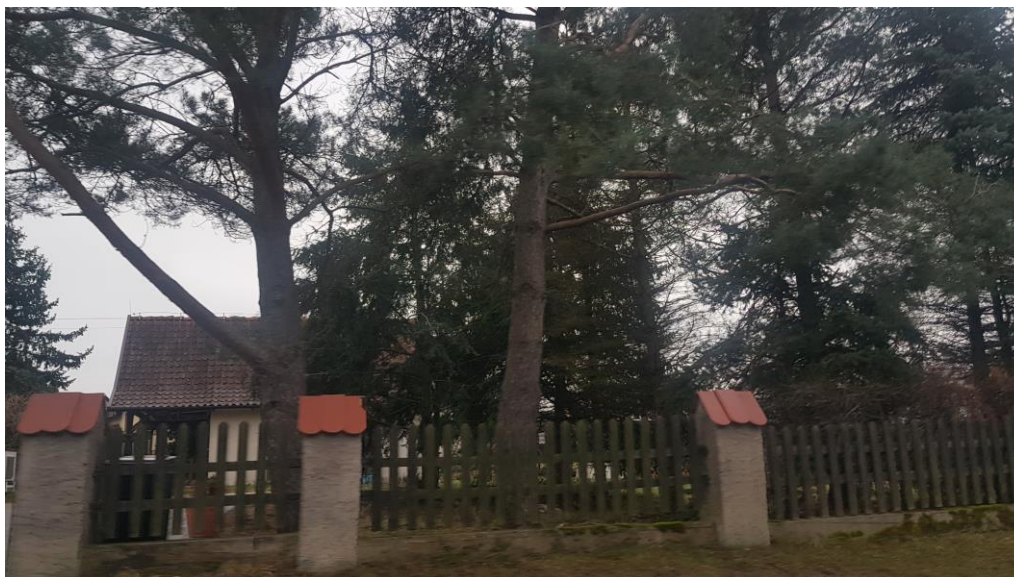
Fot.2. Grupa zadrzewień

Obszar 2 stanowi teren w większości zagospodarowany z istniejącą zabudową handlowo-usługową oraz parkingiem z wyznaczonymi miejscami postojowymi.