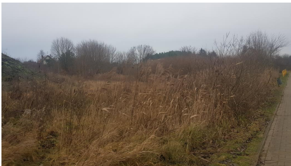
Fot.5. Nieużytek z występującą roślinnością łożową szuwarową.

Ukształtowanie terenu stanowi pozostałość po zlodowaceniu bałtyckim z przekształconą formą akumulacji lodowcowej i wodnolodowcowej z występującymi wysoczyznami falistymi. Charakteryzuje się łagodnym ukształtowaniem powierzchni. Na analizowanym obszarze występuje duże zróżnicowanie morfologiczne pomiędzy terenem zagospodarowanym z istniejącą zabudową handlowo-usługową, a terenem nieużytku. Teren o prostych warunkach gruntowo-wodnych, przydatnych pod zabudowę. Wyjątek stanowi teren nieużytku o złożonych warunkach gruntowo-wodnych, wskazany na załączniku graficznym do niniejszego opracowania. Kategorię geotechniczną całego obiektu budowlanego należy potwierdzić na podstawie badań geotechnicznych z właściwym określeniem warunków gruntowych zgodnie z rozporządzeniem Ministra Transportu, Budownictwa i Gospodarki Morskiej z dnia 25 kwietnia 2012r. w sprawie ustalania geotechnicznych warunków posadawiania obiektów budowlanych (Dz. U. z 2012r. poz. 463).