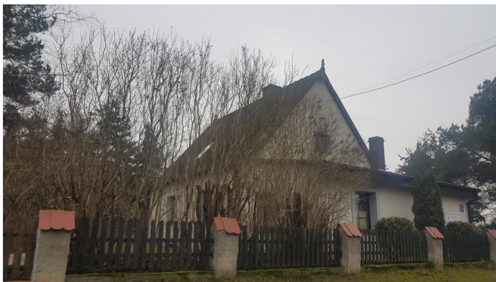
Fot. 1. Teren zagospodarowany z istniejącą zabudową mieszkalno-usługową (jednorodziną).

Obszar 1 stanowi teren zagospodarowany z istniejącą zabudową mieszkalno-usługową (jednorodziną) oraz gospodarczą.