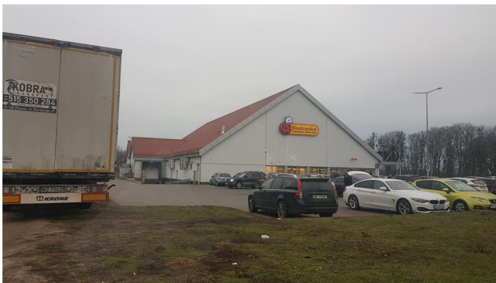
Fot.3. Teren zagospodarowany z istniejącą zabudową handlowo-usługową.

Obszar 2 stanowi teren w większości zagospodarowany z istniejącą zabudową handlowo-usługową oraz parkingiem z wyznaczonymi miejscami postojowymi.