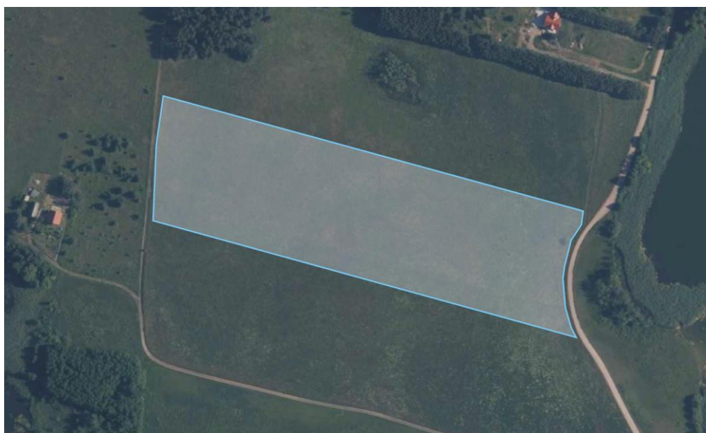
Rys. 2. teren działki o nr ew. 52 na tle ortofotomapy