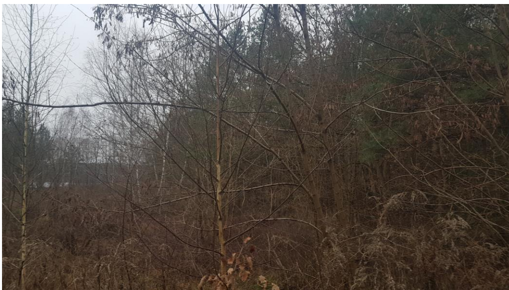
Fot. 1. płaty roślinności drzewiastej – sosna pospolita, brzoza brodawkowata