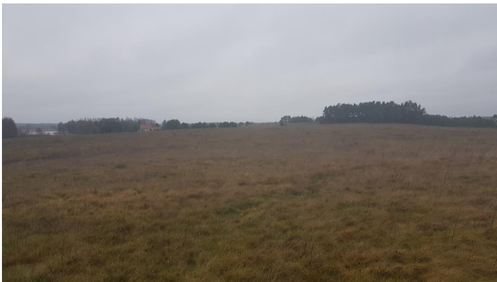
Fot. 2. Tereny ekstensywnych łąk

Ukształtowanie terenu stanowi pozostałość po zlodowaceniu bałtyckim z przekształconą formą akumulacji lodowcowej i wodnolodowcowej z występującymi wysoczyznami falistymi. Charakteryzuje się zróżnicowanym ukształtowaniem powierzchni – teren pagórkowaty. Teren o prostych warunkach gruntowo-wodnych, przydatnych pod zabudowę. Kategorię geotechniczną całego obiektu budowlanego należy potwierdzić na podstawie badań geotechnicznych z właściwym określeniem warunków gruntowych zgodnie z rozporządzeniem Ministra Transportu, Budownictwa i Gospodarki Morskiej z dnia 25 kwietnia 2012r. w sprawie ustalania geotechnicznych warunków posadawiania obiektów budowlanych (Dz. U. z 2012r. poz. 463).