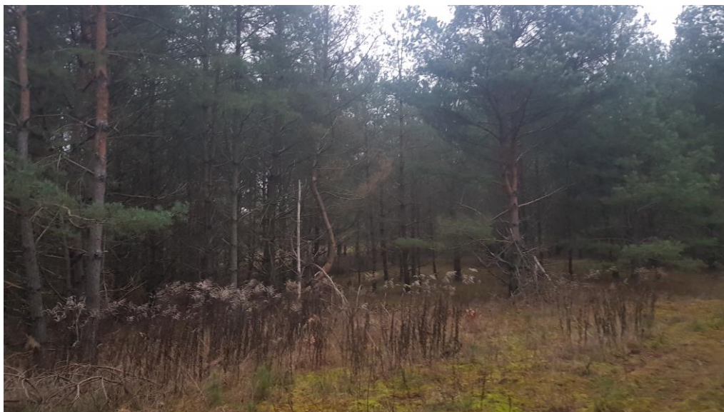
Fot. 1. roślinność drzewiasta – sosna pospolita

Teren planowanej inwestycji porośnięty jest roślinnością krzewiastą, drzewiastą.