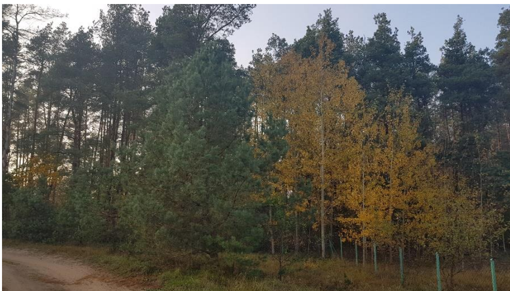
fot. zwarty kompleks leśny

Strefę ekotonową jeziora Kalwa stanowi niewielki kompleks leśny – bór mieszany świeży wraz z roślinnością przybrzeżną. Z analizy taksacyjnego składu gatunkowego lasu wynika, iż głównym gatunkiem lasotwórczym jest sosna pospolita. Uzupełnienie stanowi brzoza brodawkowata, topola osika.