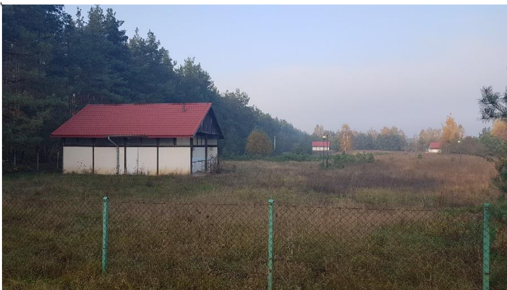
fot. tereny z istniejącą zabudową letniskową

Strefę ekotonową jeziora Kalwa stanowi niewielki kompleks leśny – bór mieszany świeży wraz z roślinnością przybrzeżną. Z analizy taksacyjnego składu gatunkowego lasu wynika, iż głównym gatunkiem lasotwórczym jest sosna pospolita. Uzupełnienie stanowi brzoza brodawkowata, topola osika.