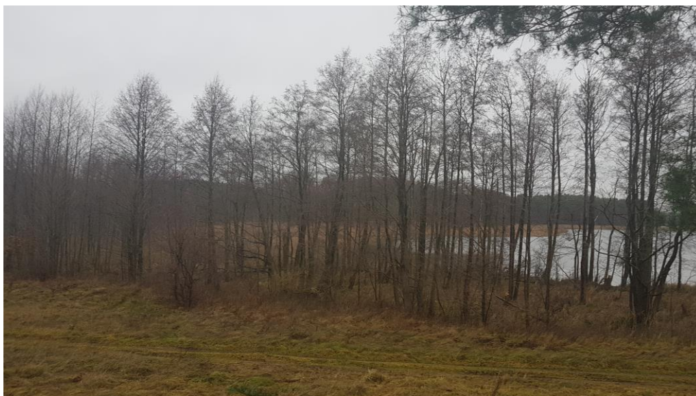
Fot.3. zbiorowisko olsu o zróżnicowanych warunkach gruntowo-wodnych

Cechą charakterystyczną analizowanego obszaru jest występowanie zbiorowiska olsu o zróżnicowanych warunkach gruntowo-wodnych. Przyjeziornemu obniżeniu terenu towarzyszy także roślinność łożowa i szuwarowa. Podłoże stanowią okresowo nadmiernie uwilgotnione gleby murszowe o różnym stopniu zmineralizowania.