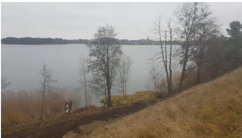
Fot. 5. Skarpa o stromym zboczu

Ukształtowanie terenu stanowi pozostałość po zlodowaceniu bałtyckim z przekształconą formą akumulacji lodowcowej i wodnolodowcowej z występującymi wysoczyznami falistymi. Charakteryzuje się zróżnicowanym ukształtowaniem powierzchni – teren pagórkowaty. Na analizowanym terenie występuje skarpa o bardzo stromym zboczu.