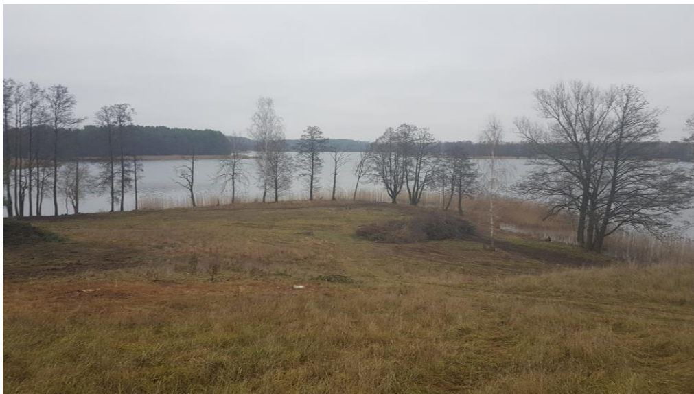
Fot.4. pojedyncze zadrzewienia wraz z roślinnością przywodną okalającą jezioro

Ukształtowanie terenu stanowi pozostałość po zlodowaceniu bałtyckim z przekształconą formą akumulacji lodowcowej i wodnolodowcowej z występującymi wysoczyznami falistymi. Charakteryzuje się zróżnicowanym ukształtowaniem powierzchni – teren pagórkowaty. Na analizowanym terenie występuje skarpa o bardzo stromym zboczu.