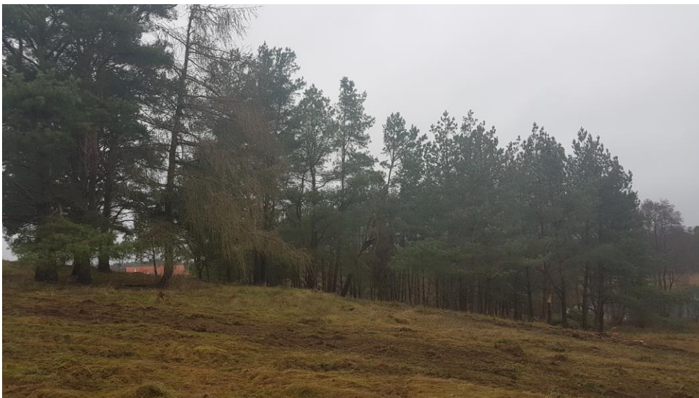
Fot.2. płaty roślinności drzewiastej – sosna pospolita

Cechą charakterystyczną analizowanego obszaru jest występowanie zbiorowiska olsu o zróżnicowanych warunkach gruntowo-wodnych. Przyjeziornemu obniżeniu terenu towarzyszy także roślinność łożowa i szuwarowa. Podłoże stanowią okresowo nadmiernie uwilgotnione gleby murszowe o różnym stopniu zmineralizowania.