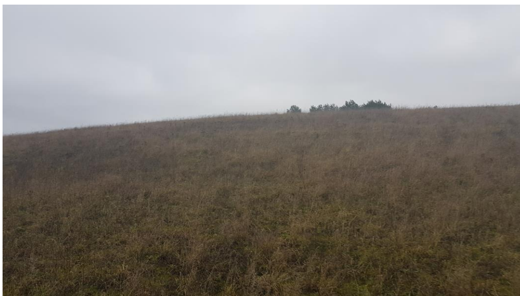
Fot.1. Tereny ekstensywnych łąk

Na aktualną strukturę użytkowania omawianego obszaru składa się teren ekstensywnych łąk z postępującą fragmentarycznie sukcesją roślinności krzewiastej, drzewiastej. Warstwę zielną omawianego terenu stanowią pospolite gatunki traw, bylin i chwastów.