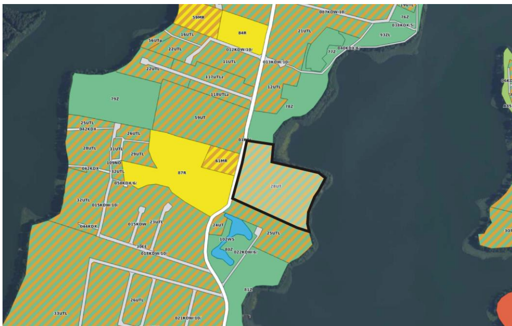
Rys.2. obszar analizowany na tle obowiązującego mpzp