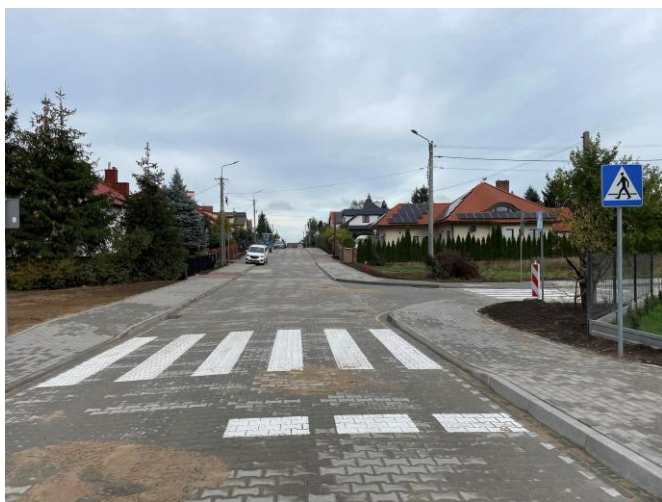
Fot. Przebudowana ulica Michała Kajki w Pasymiu

Na koniec 2024 roku w Urzędzie Miasta i Gminy w Pasymiu zatrudnionych było 31 osób, w tym na stanowiskach urzędniczych 25 osób i na stanowiskach pomocniczych 6. W trakcie całego roku nie wykonywano prac społeczno-użytecznych na rzecz gminy natomiast 4 osoby były w Urzędzie na praktykach zawodowych.