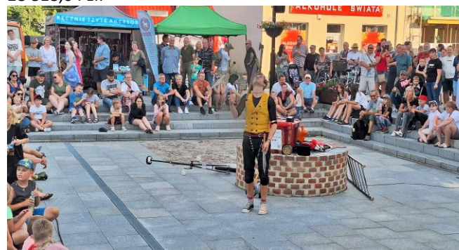
Fot. Festiwal Sztuk Ulicznych 2024

W 2024 roku Miejski Ośrodek Kultury realizował dwa projekty w ramach Programu Równać Szanse 2023 i Równać Szanse 2024 Polsko-Amerykańskiej Fundacji Wolności. Wartość obydwu projektów wynosiła łącznie 28 818,04 zł.